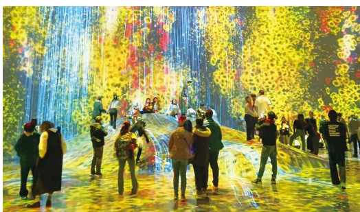
エプソンチームラボボーダレスの様子(麻布台ヒルズ)