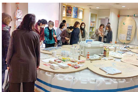
防災グッズ見学の様子(そなエリア東京)

3月6日(水)事業委員会・福利厚生委員会合同による「視察親睦会」を実施いたしました。今回は、「そなエリア東京(防災体験学習施設)視察」、「麻布台ヒルズ(エプソンチームラボ ボーダレス)体験」をしました。参加者の皆様と交流を深めながら、有意義な時間を過ごしました。