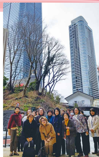
集合写真(麻布台ヒルズ前)