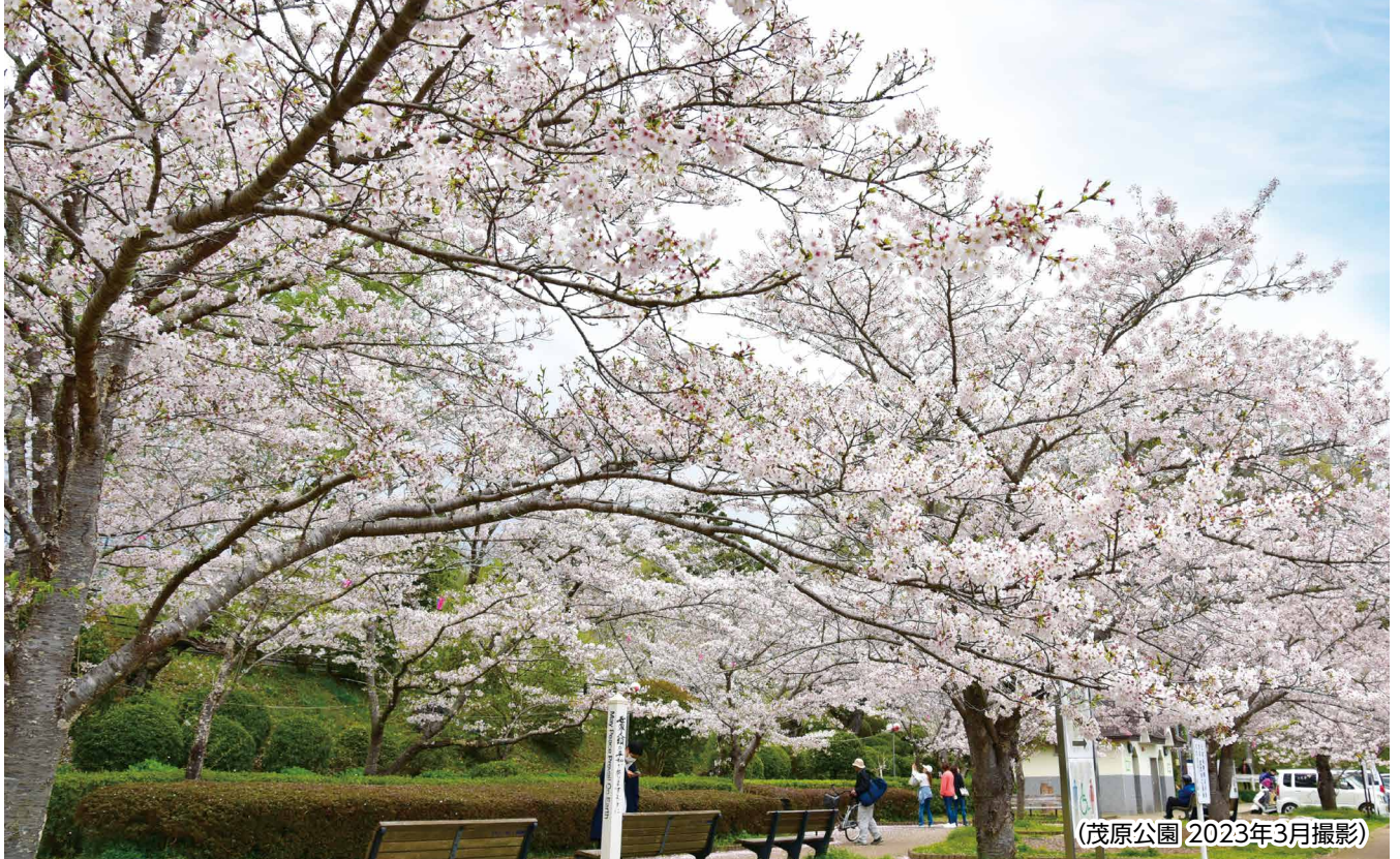
(茂原公園 2023年3月撮影)

商工もばら 第592号 (毎月1回発行) 発行所:茂原商工会議所 茂原市茂原443番地 tel.22-3361(代) 発行責任者:河野万由美 編集責任者:石野 里実