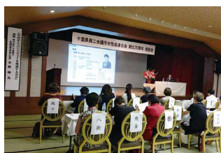
講演会の様子1 (なぜダイバーシティを推進するのか)