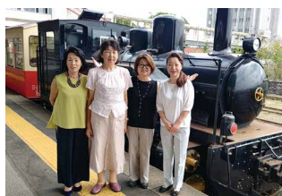
トロッコ列車前での様子

2日間天候に恵まれ、たくさんの自然に触れ、県内他女性会と交流を深めることができ、有意義な研修会となりました。