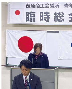
来年度会長の挨拶