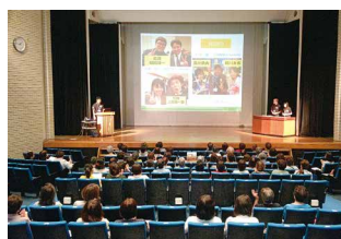
講演会の様子2 (茂原市のロケツーリズム)