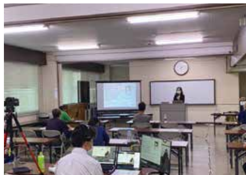
茂原創業塾2021(プレセミナーの様子)