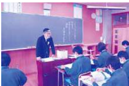
茂原商工会議所(地域経済団体)