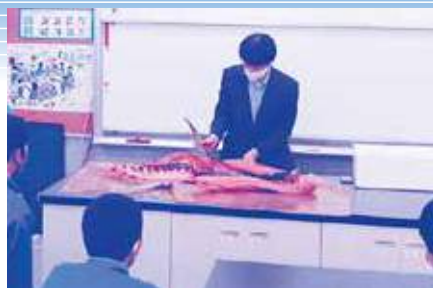
カネヨ水産(株)(鮮魚卸売業)