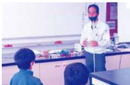
茂原産業(株)(製造業)