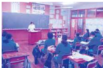
創作スイーツ&フレンチ レーヴ(パティシエ)