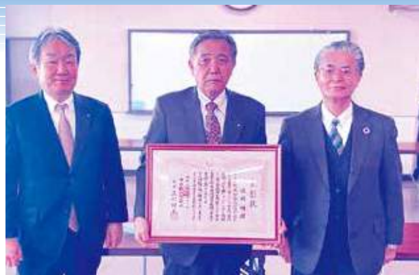
日本商工会議所永年勤続表彰