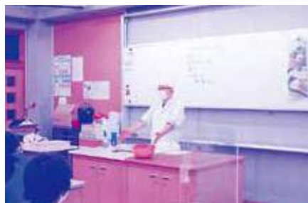
三矢菓子店(和菓子職人)