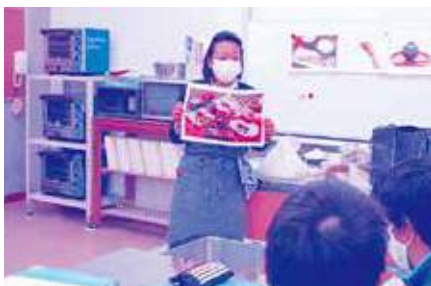
どんなか川(飲食店)