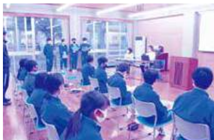
社会福祉法人 長生共楽園(介護施設)