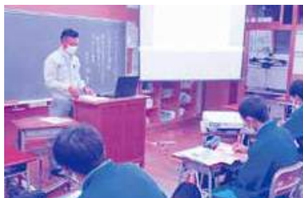
(有)ニチタケ建設(建設業)