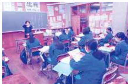
ナルケ薬粧(美容・エステ業)