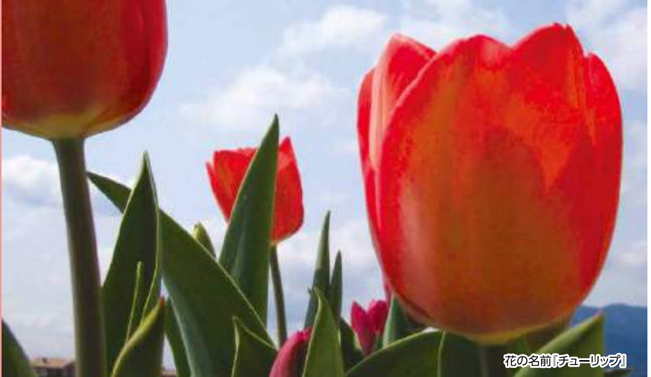
花の名前「チューリップ」