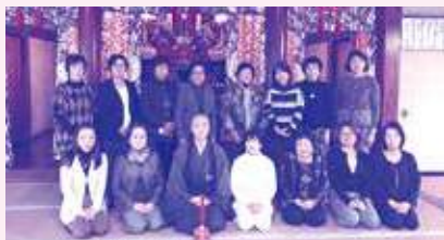
視察研修会(横浜林香寺)