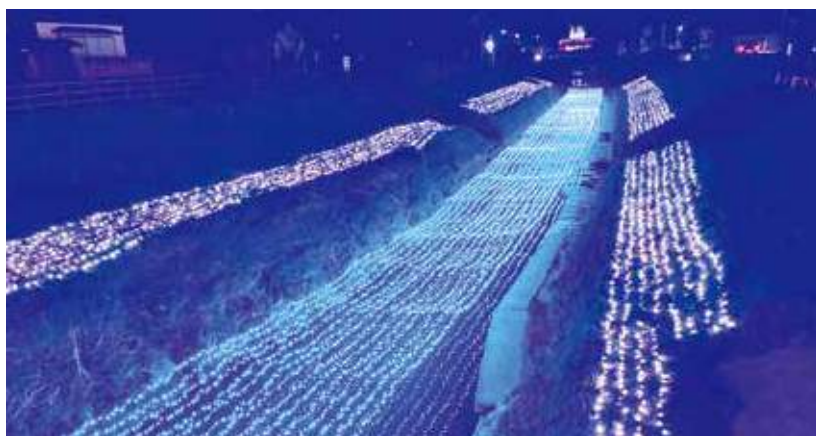
冬の七夕「イルミネーション」

2月9日(日)今年で6回目となる「もばら冬の七夕まつり」が開催されました。冬の七夕まつりは、冬季にも多くの人に訪れてもらい地域活性化を図ろうと、2015年から行っています。