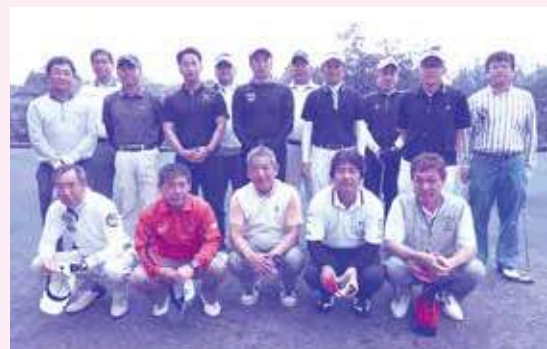
工業春秋会参加者集合写真