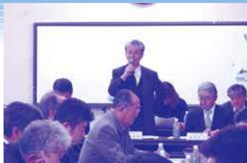
茂原七夕まつり実行委員会の様子

第65回茂原七夕まつりの期日は、7月26日(金)～28日(日)の3日間です。みなさまぜひお楽しみにしてください!