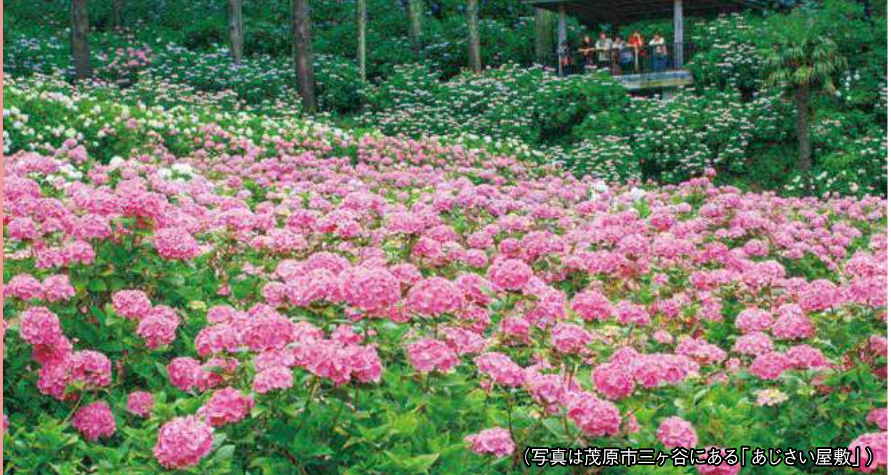
(写真は茂原市三ヶ谷にある「あじさい屋敷」)