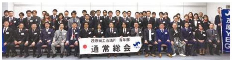
通常総会集合写真

議事内容について、2019(平成31)年度 1. 茂原商工会議所青年部規約の改定の件、2. 基本方針(案)、事業計画(案)、年間スケジュール(案)、組織(案)承認の件、3. 収支予算(案)承認の件がそれぞれ満場一致で承認されました。