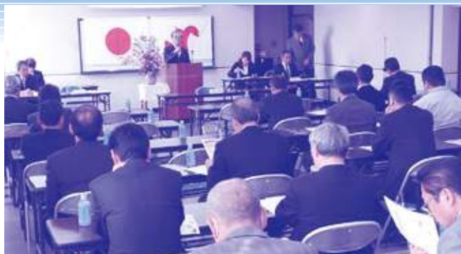
通常議員総会の様子

秋葉会頭の挨拶の後、2019(平成31)年度事業計画(案)・収支予算(案)、平成30年度中小企業相談所特別会計収支補正予算(案)、常議員選任(案)について審議を行い、それぞれ原案通り可決承認されました。