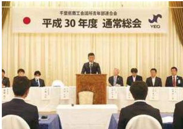
県青連総会の様子

また、総会后に開催された懇親会では今年度関東ブロック大会の開催地である春日部YEGがPRで来場するなど会場は盛大に盛り上がりました。