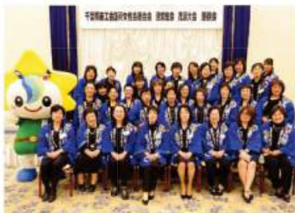
「茂原商工会議所女性会集合写真」