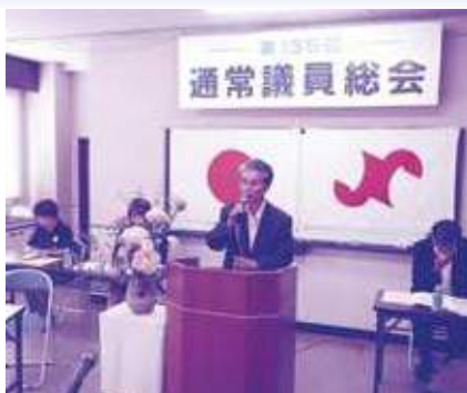
通常議員総会の様子