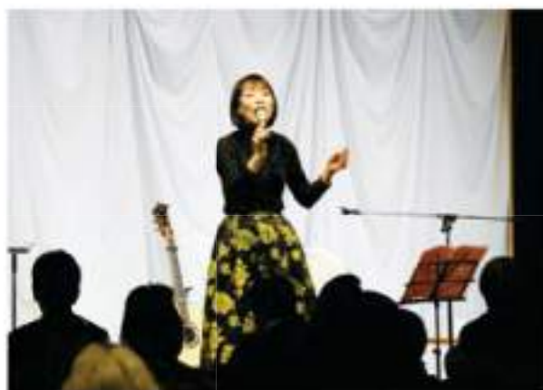
「白鳥英美子様ミニコンサート」