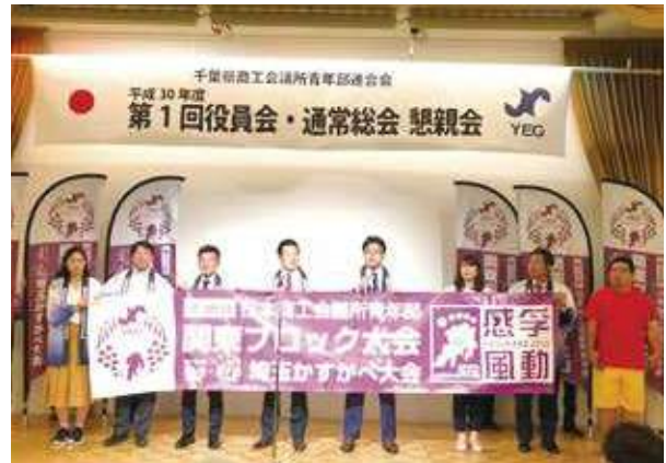
県青連総会 懇親会の様子