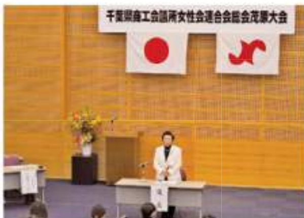
「千葉県商工会議所女性会連合会会長挨拶」

最後に、茂原大会開催に際し、多大なるご支援ご協力をいただきました、関係各位にこの場をお借りしてお礼申し上げます。