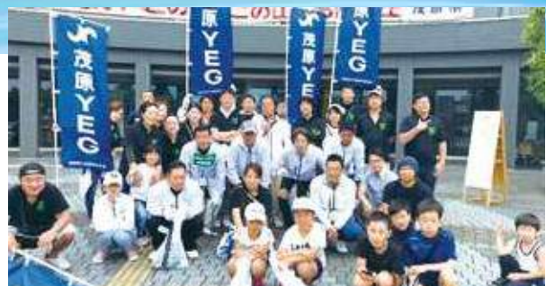
ゴミゼロ運動参加メンバーとご家族