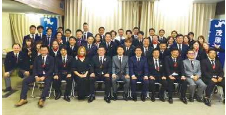
通常総会参加メンバー