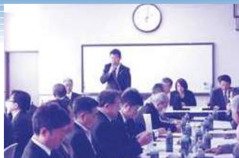
茂原七夕まつり実行委員会の様子

第64回茂原七夕まつりの期日は、7月27日(金)～29日(日)の3日間です。皆様ぜひお楽しみにしてください!