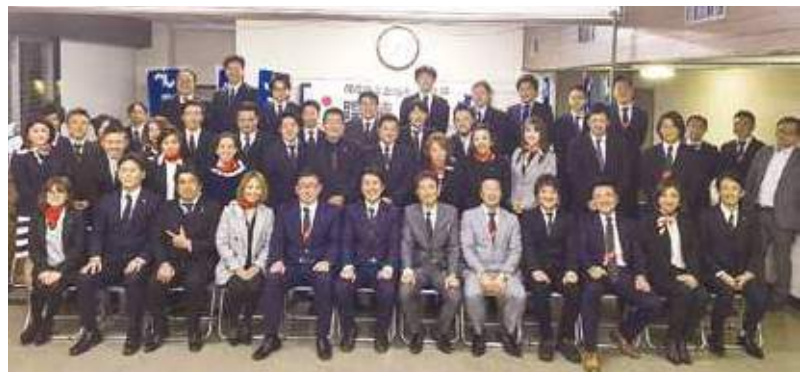
臨時総会 集合写真

議事内容について、1. 茂原商工会議所青年部規約の改定の件、2. 平成30年度基本方針(案)、平成30年度事業計画(案)、平成30年度年間スケジュール(案)、平成30年度組織図(案)承認の件、3. 平成30年度収支予算(案)承認の件がそれぞれ満場一致で承認されました。