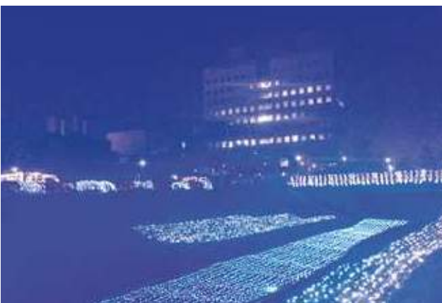
イルミネーションの様子

またメインイベントの2月10日には当青年部が用意した足湯「冬タナの湯」や、キッチンカーでの飲食店出店、まぐろの解体ショーなどが行われました。まぐろ丼無料配布などを楽しむ家族連れやカップルで賑わいました。