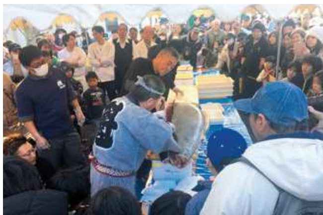
マグロ解体ショーの様子