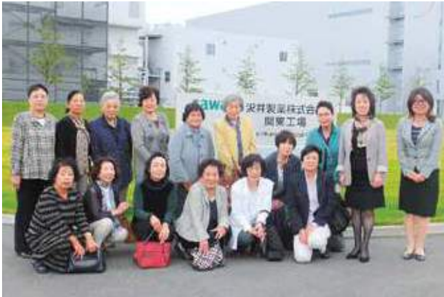
『沢井製薬にて視察研修』

茂原商工会議所女性会は、新入会員の募集を行っております。社会で活躍する女性として、当女性会の活動を通じ地域振興や今後の街づくりを一緒に考えてみませんか？