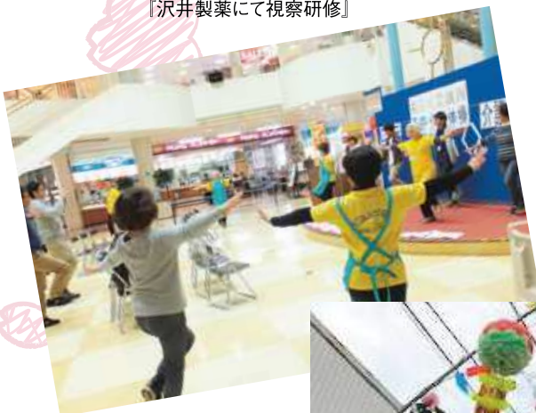
『もばら百歳体操の様子』