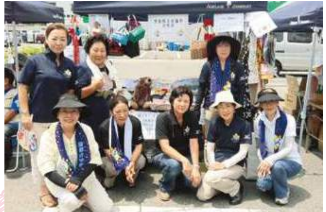
『茂原七夕まつり出店の様子』