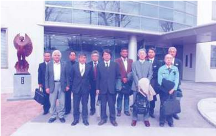
工業部会 集合写真