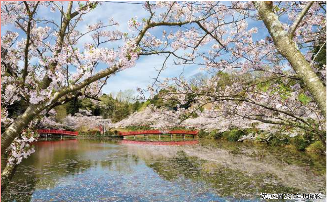
(茂原公園 2017年4月撮影)