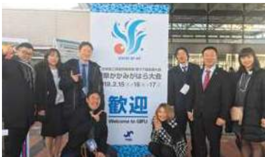
全国大会に参加したメンバー

2月16日(金)~17日(土)、保川会長を含む8名で、日本YEG第37回全国大会岐阜かがみがはら大会へ参加しました。