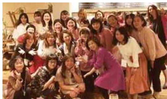
経営女子会に参加したメンバー

この「経営女子会」は、他青年部から注目されており、今回は多くの他青年部が視察に来られました。